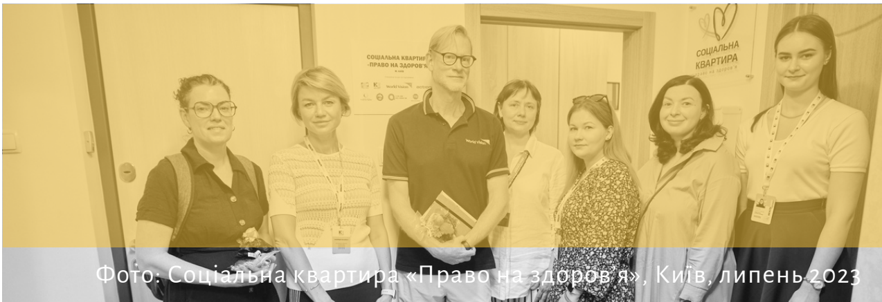
Фото: Соціальна квартира «Право на здоров'я», Київ, липень 2023