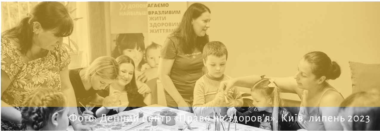
Фото: Денний центр «Право на здоров'я», Київ, липень 2023