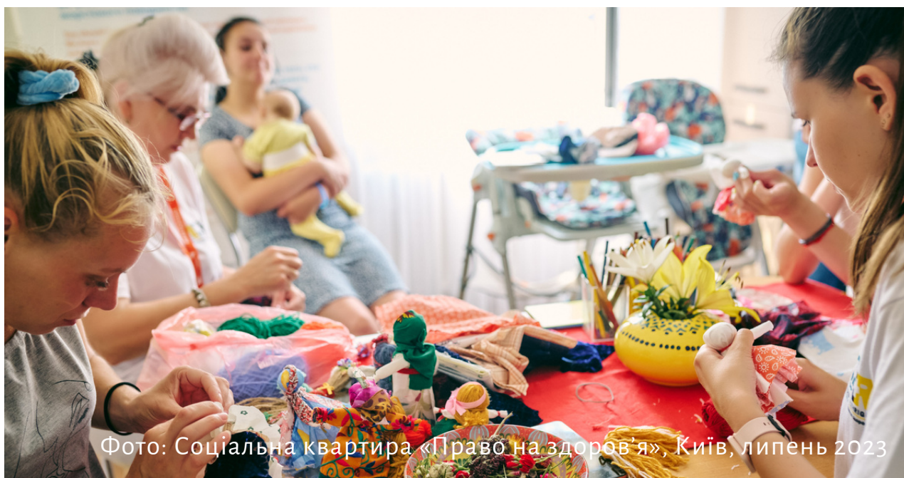
Фото: Соціальна квартира «Право на здоров'я», Київ, липень 2023

Фізичне насильство - форма домашнього насильства, що включає ляпаси, стусани, штовхання, щипання, шмагання, кусання, а також незаконне позбавлення волі, нанесення побоїв, мордування, заподіяння тілесних ушкоджень різного ступеня тяжкості, залишення в небезпеці, ненадання допомоги особі, яка перебуває в небезпечному для життя стані, заподіяння смерті, вчинення інших правопорушень насильницького характеру.