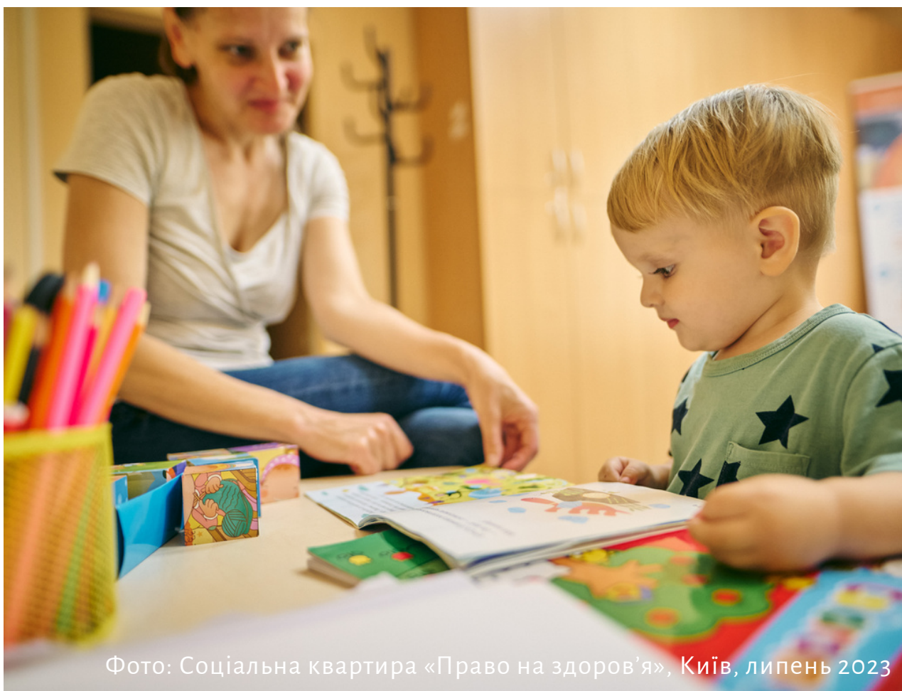
Фото: Соціальна квартира «Право на здоров'я», Київ, липень 2023