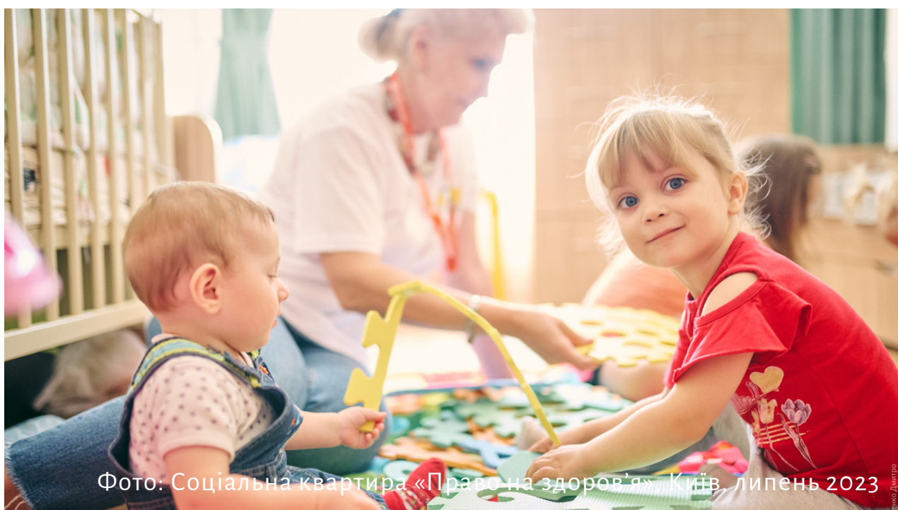
Фото: Соціальна квартира «Право на здоров'я», Київ, липень 2023

Ця спільна діяльність та взаємодія дозволяє нам досягати кращих результатів у наданні підтримки та допомоги тим, хто її найбільше потребує. Впевненість у силі співпраці та вдячність нашим партнерам і волонтерам є запорукою успіху нашої місії.