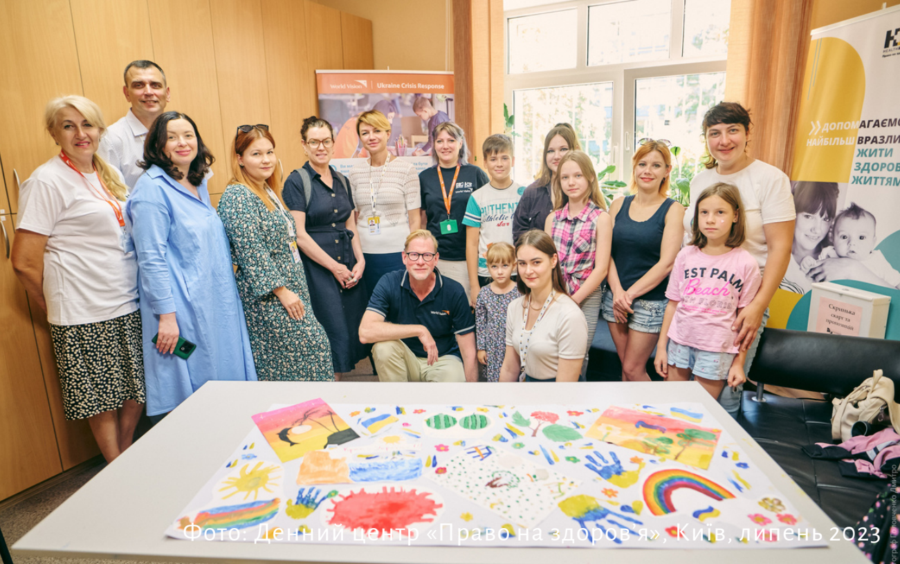
Фото: Денний центр «Право на здоров'я», Київ, липень 2023