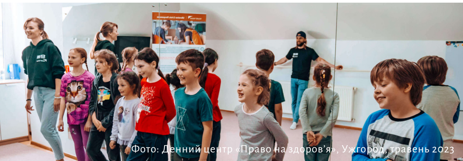
Фото: Денний центр «Право на здоров'я», Ужгород, травень 2023

Клієнт/клієнтка може звернутись самостійно до мультидисциплінарної мобільної команди, денного центру або соціальної квартири. Фахівці, які вперше працюють із випадком, здійснюють первинну оцінку потреб та надають особі вичерпну інформацію щодо послуг, які вона може отримати від мультидисциплінарної мобільної команди, денного центру або соціальної квартири, і за необхідності, перенаправляють до інших суб'єктів надання допомоги.