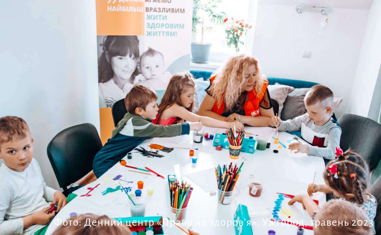
Фото: Денний центр «Право на здоров'я», Ужгород, травень 2023