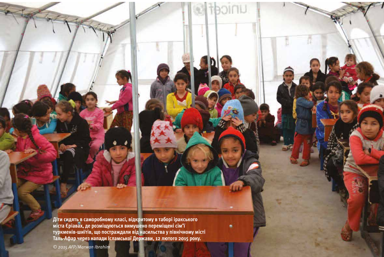
Діти сидять в саморобному класі, відкритому в таборі іракського міста Єрівах, де розміщуються вимушено переміщені сім'ї туркменів-шиїтів, що постраждали від насильства у північному місті Таль-Афар через напади Ісламської Держави, 12 лютого 2015 року.