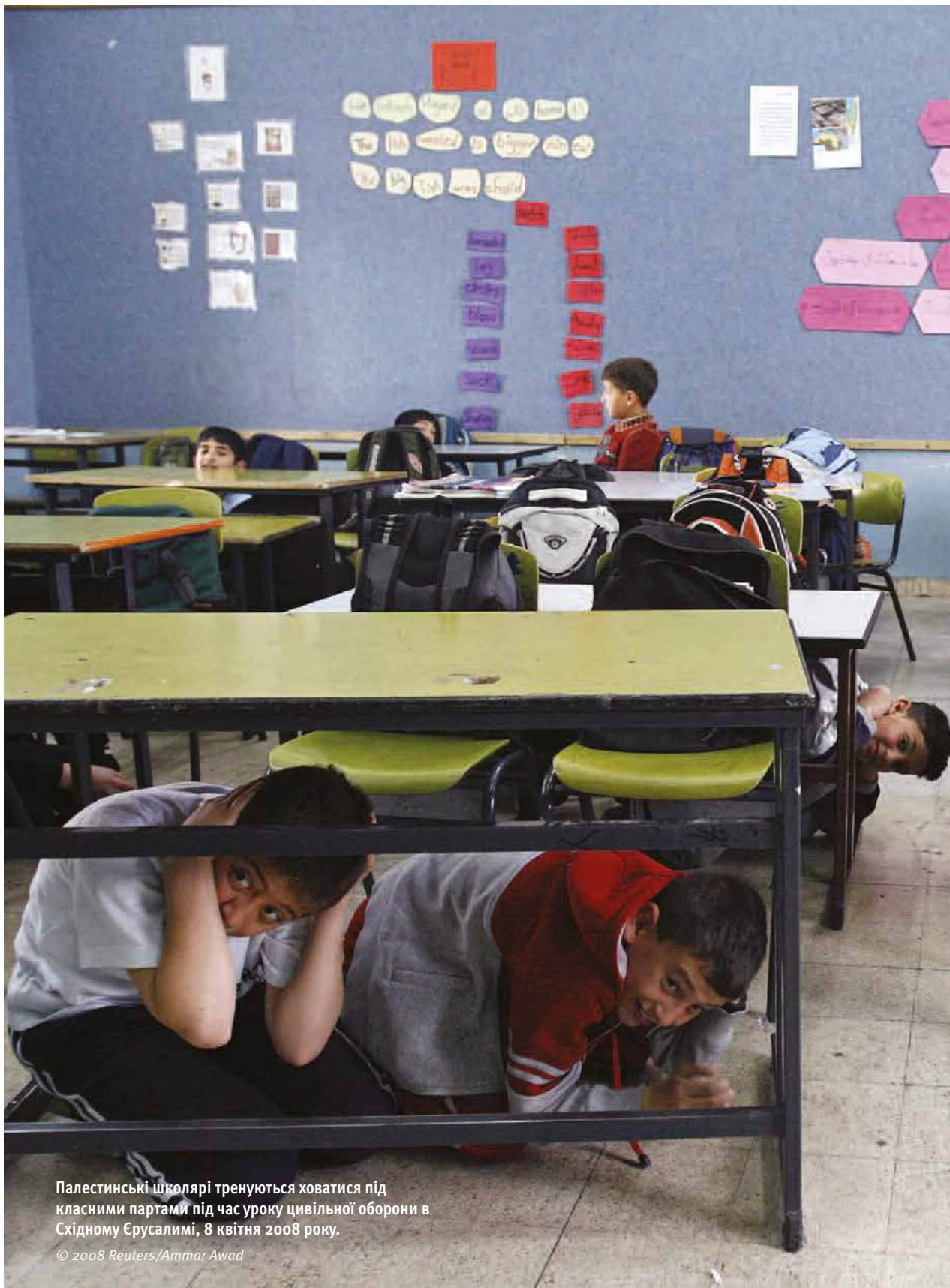
Палестинські школярі тренуються ховатися під класними партами під час уроку цивільної оборони в Східному Єрусалимі, 8 квітня 2008 року.