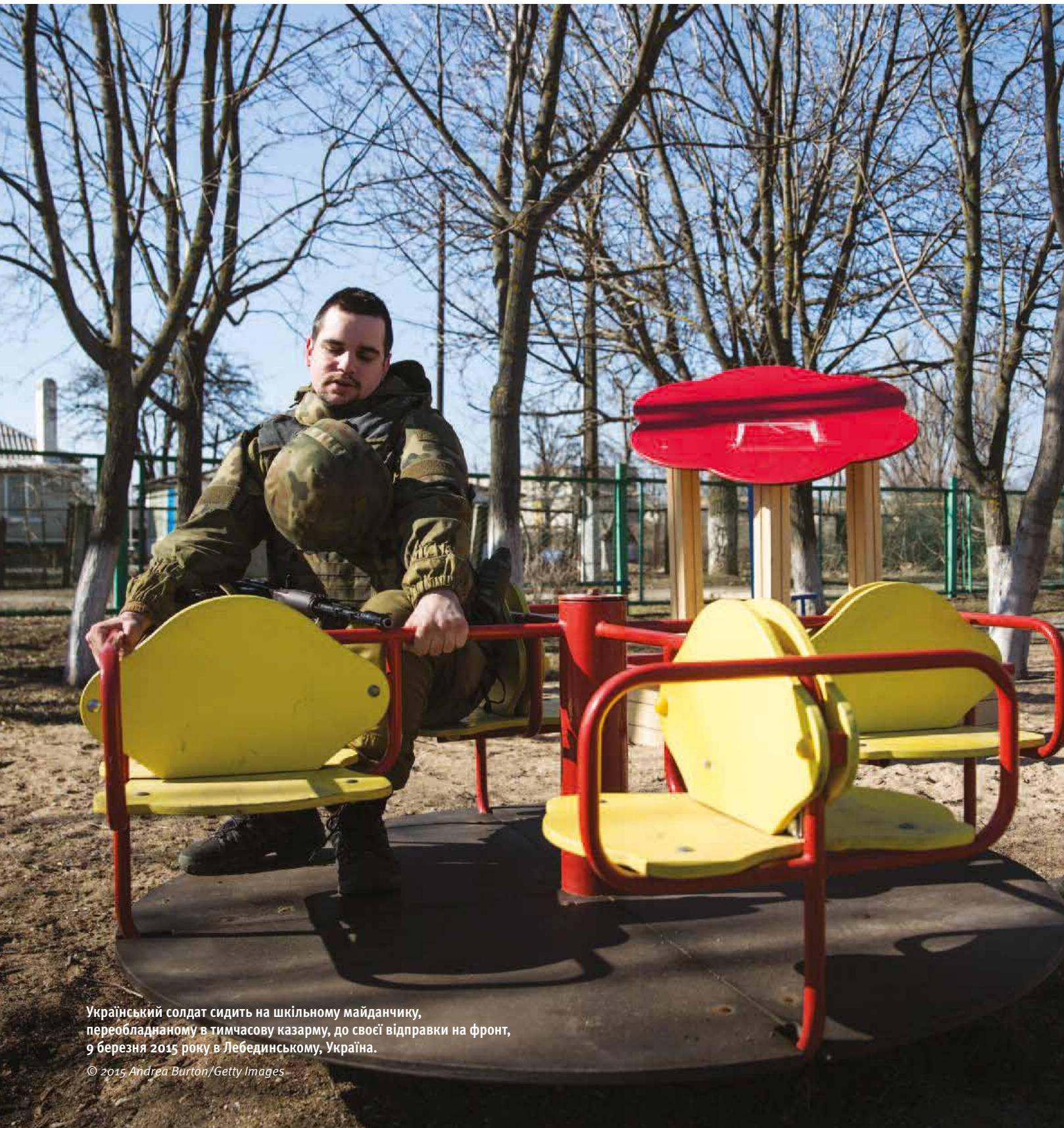
Український солдат сидить на шкільному майданчику, переобладнаному в тимчасову казарму, до своєї відправки на фронт, 9 березня 2015 року в Лебединському, Україна.