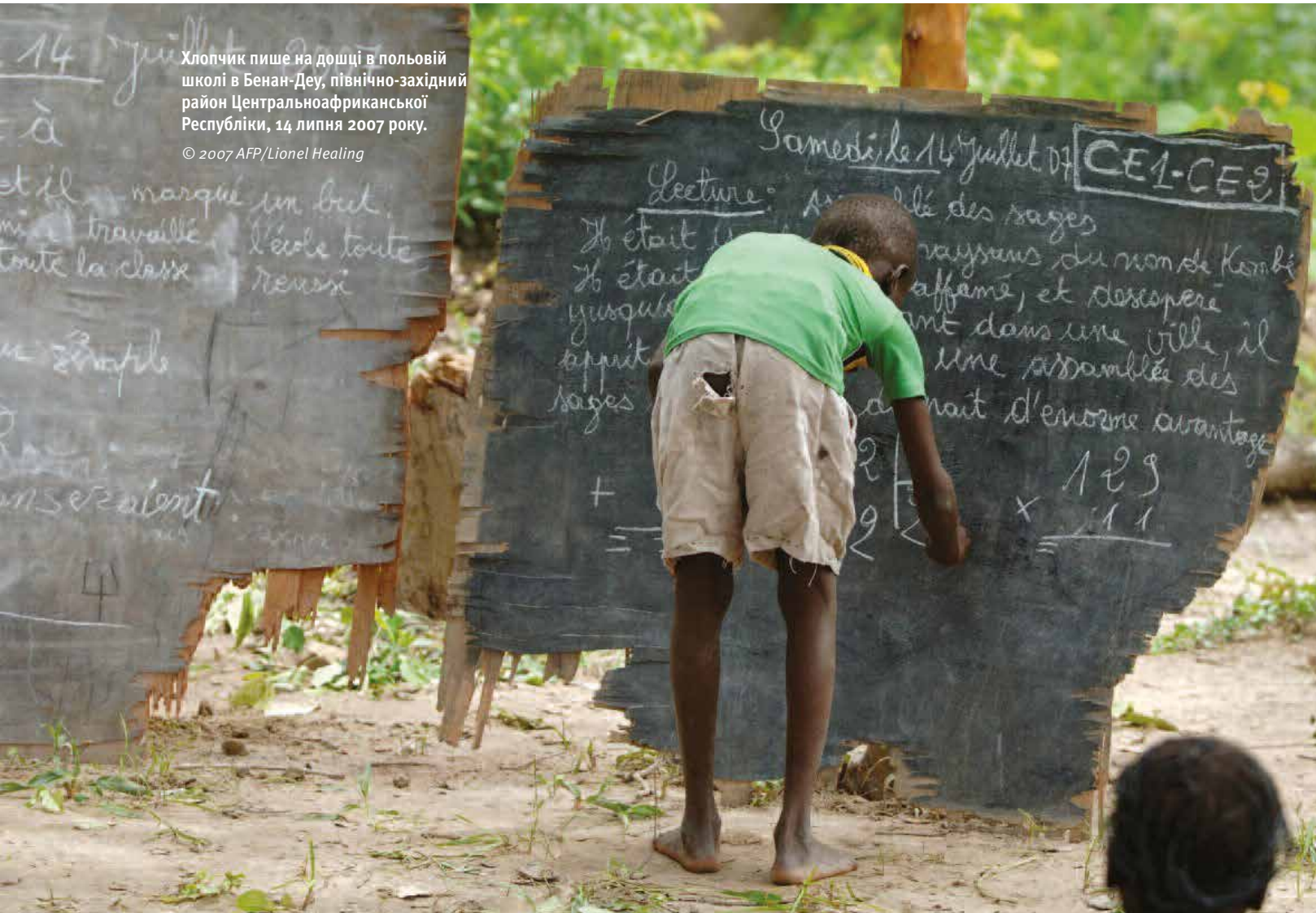
Хлопчик пише на дошці в польовій школі в Бенан-Деу, північно-західний район Центральноафриканської Республіки, 14 липня 2007 року.