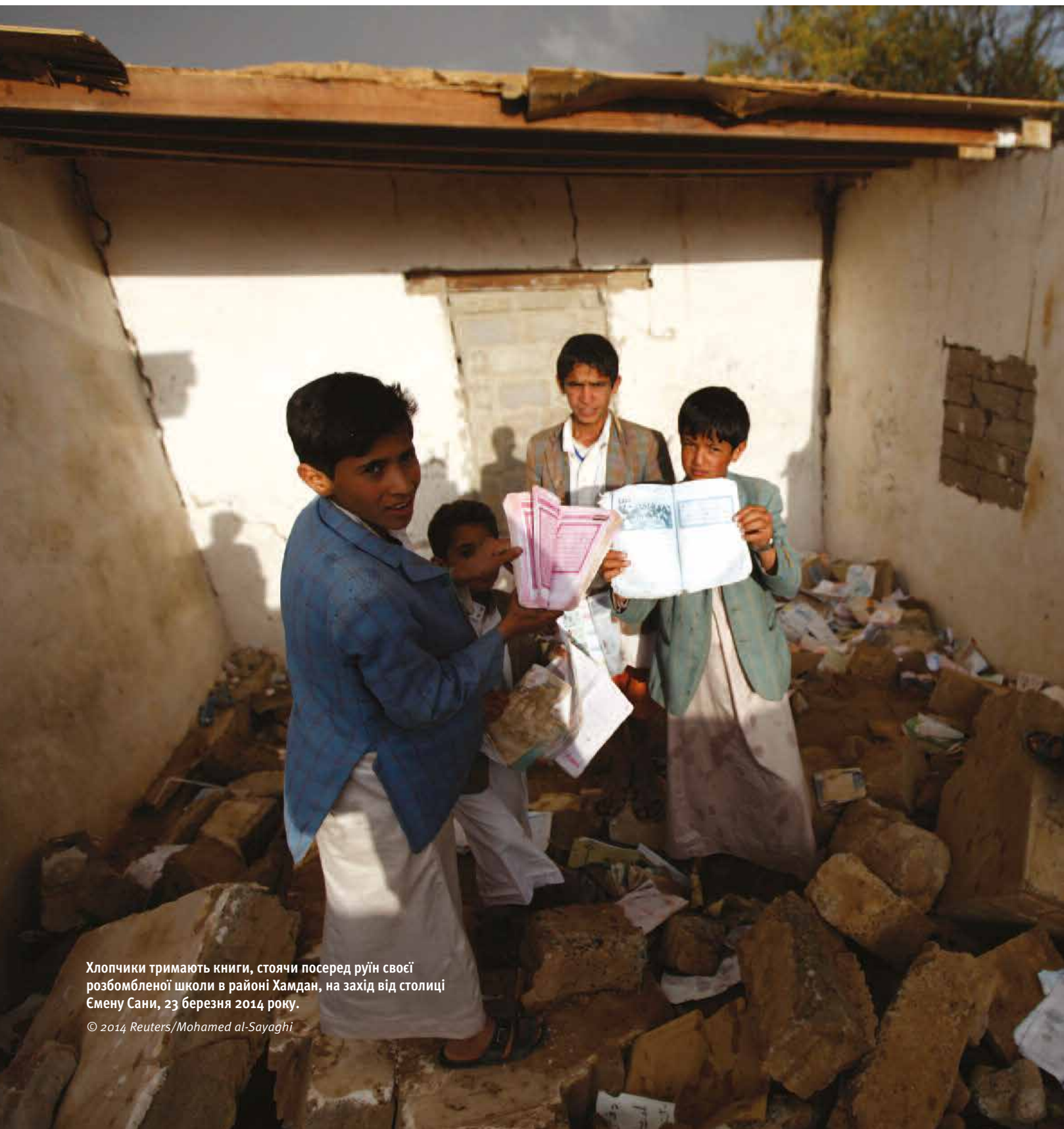
Хлопчики тримають книги, стоячи посеред руїн своєї розбомбленої школи в районі Хамдан, на захід від столиці Ємену Сани, 23 березня 2014 року.