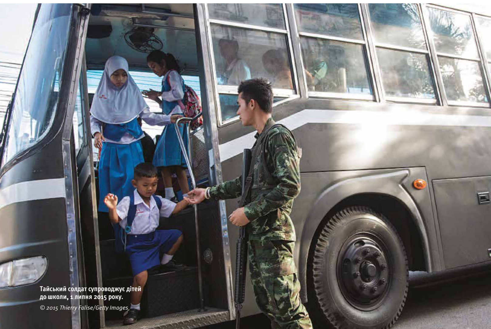
Тайський солдат супроводжує дітей до школи, 1 липня 2015 року.