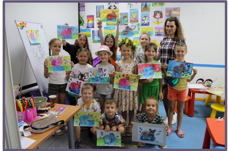
Фото 3. Фото з Дитячої точки «Спільно» в Охтирському молодіжному

Впровадження партисипативного підходу означає залучення самих дітей до процесів планування, прийняття рішень та оцінювання діяльності ПДД. Їхні думки, вподобання та ідеї мають активно запитуватися та враховуватися. Залучаючи дітей до цих процесів, ПДД стає більш пристосованим до їхніх потреб і бажань, що сприяє формуванню у дітей почуття причетності та розширенню їхніх прав і можливостей.