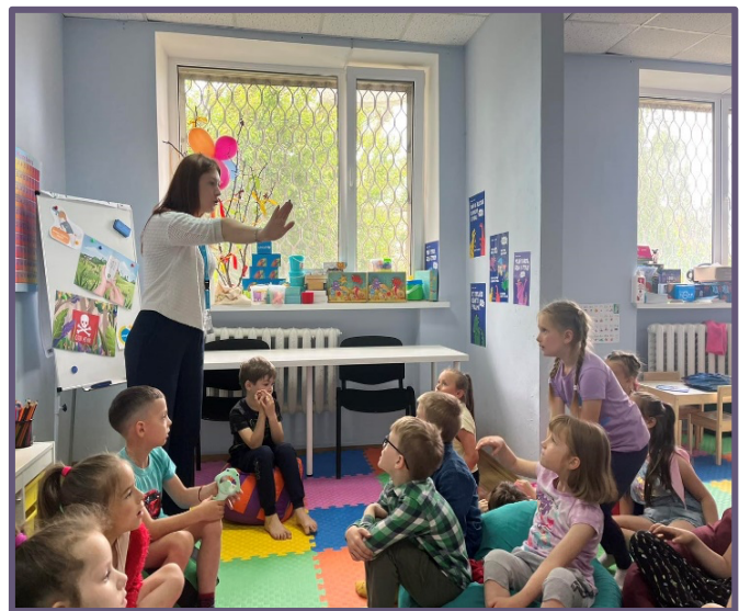
Фото 1. Координатори Дитячої точки «Спільно» Малин провели освітньо-інформаційну бесіду для учнів школи №

Простори, дружні до дітей та підлітків (ПДД/ПДП), використовуються гуманітарними організаціями для розширення доступу дітей та підлітків до безпечного середовища та сприяння їхньому психосоціальному благополуччю. Усі групові заходи, спрямовані на благополуччя дітей та підлітків, такі як ПДД/ПДП, мають бути частиною загальних зусиль із захисту дітей в умовах надзвичайної ситуації/захисту дітей у гуманітарній діяльності, які доповнюють і координують інші заходи, такі як освіта або харчування, щоб забезпечувати дітям цілісну підтримку. У таких центрах батьки та опікуни можуть отримати підтримку та дізнатися більше про догляд та захист своїх дітей та підлітків.