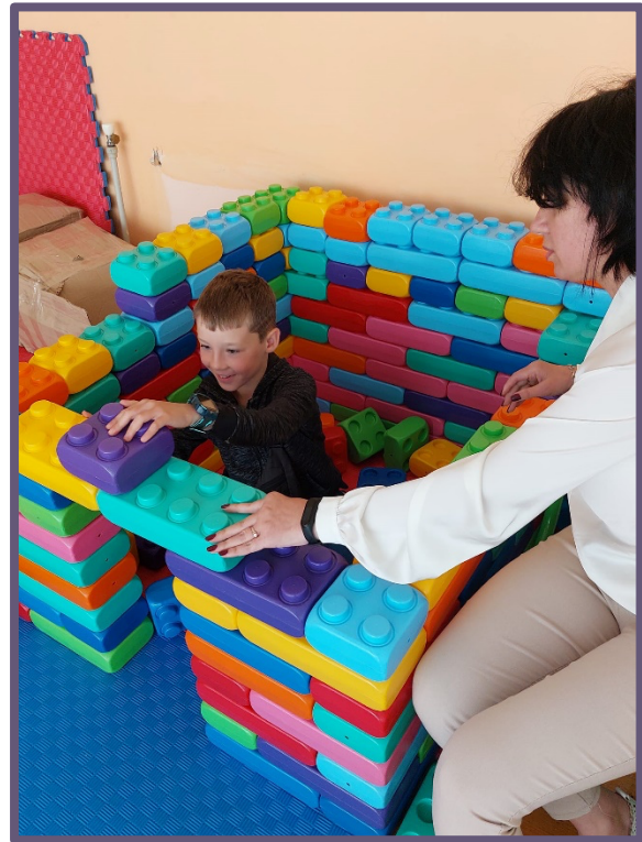
Фото 2 Фото з Дитячої точки «Спільно» в Калуському ліцеї № 7.

Організовуючи групові заходи для дітей та підлітків, важливо враховувати їхній вік, стать та будь-які обмежені можливості, які вони можуть мати. Деякі ПДД/ПДП пристосовані для конкретних вікових груп, наприклад, простори, дружні до дитини, призначені для матерів і немовлят, або простори, дружні до дівчат, – для дівчат-підлітків.